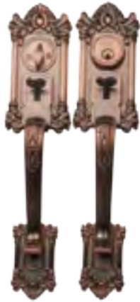
มือจับประตูแบบดึง ENTRANCE HANDLE SET รุ่น : VTF-01

วัสดุ : ชิงก์ อัลลอยด์ สี : ทองแดง วัสดุคือค : สแตนเลส สตีล