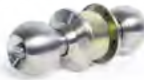
ลูกบิดประตู LEVER KEYED ENTRY รุ่น : VTF-04

วัสดุ : ทองเหลือง สี : สแตนเลสด้าน บิดได้ : มากกว่า 200,000 ครั้ง