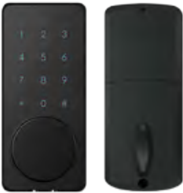
MODEL : DT-01