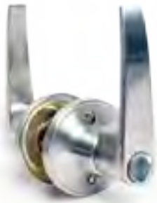
ลูกบิดประตู LEVER KEYED ENTRY รุ่น : VTF-03

วัสดุ : ทองเหลือง สี : สแตนเลสด้าน บิดได้ : มากกว่า 200,000 ครั้ง