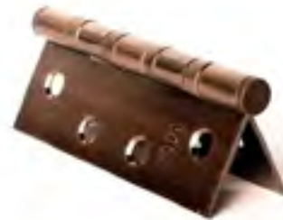
บานพับประตู HINGE รุ่น : VTF-06

วัสดุ : สแตนเลส สตีล สี : สแตนเลสด้าน ลูกบิด : 4 ตลับ