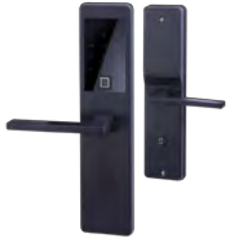
MODEL : DT-03