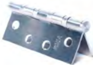
บานพับประตู HINGE รุ่น : VTF-05

วัสดุ : ทองเหลือง สี : สแตนเลสด้าน บิดได้ : มากกว่า 200,000 ครั้ง