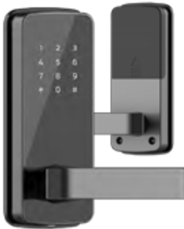
MODEL : DT-02